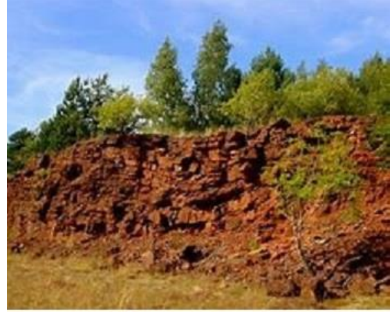
الأرض الحمراء La terre rouge