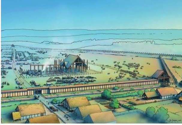
reconstitution إعادة الإعمار

كان يتم عقد الاجتماعات السياسية، الاحتفالات الدينية ومعارض للحيوانات في المنطقة وتم بناء المنازل فوق أعمدة على جانبي الطريق الرئيسي.