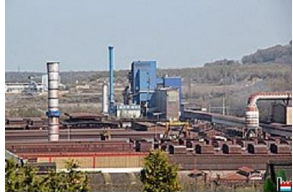
مصنع ديفردنج L'usine de Differdange