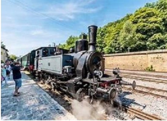
قطار ١٩٠٠ Le train 1900

حاليا، ينتقل قطار ١٩٠٠ بين موقع Fond-de-Gras ومدينة بيتانج على خط التعدين القديم ويمكن تشبيه الرحلة على متن القاطرة البخارية برحلة حقيقية عبر الزمن.