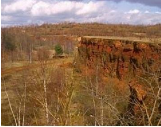
موقع لإستخراج خام الحديد l'exploitation à ciel ouvert

عند الاتجاه إلى الشرق ترون مصنع Esch-Belval الذي كان واحداً من أكبر مواقع إنتاج الفولاذ في العالم. اليوم، أفران الصهر متوقفة، ولكن لا يزال يتم إنتاج الفولاذ، وصفائح معدنية تستخدم لبناء الجدران. تم تحويل جزء من المصنع إلى موقع للإسكان والنشاط الاقتصادي وتم تركيز جامعة لوكسمبورغ هناك أيضاً.