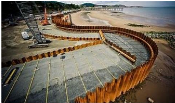
جدار من العوارض الفولاذية un mur construit avec des palplanches