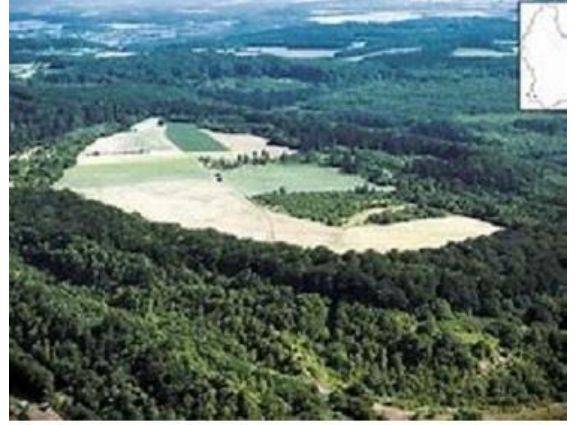
مساحة من المدينة السلتية في موقع تيتلبرغ l'étendue de la cité celté au Titelberg