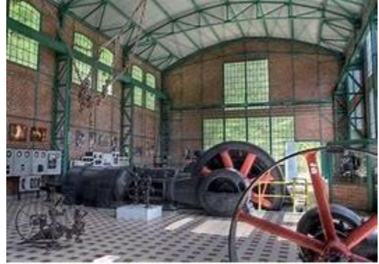
المتحف Le musée