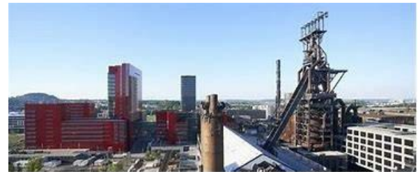
مصنع ايش بلفال L'usine d'Esch-Belval