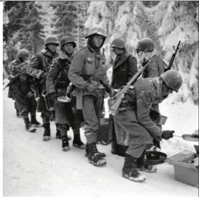
فوجنت الجيوش بالثلوج وبالبرد القارص