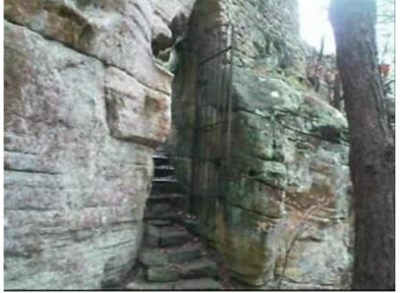
L'entrée de la Heringerbuerg مدخل الهرنبويش

الكثيرون يتحدثون عن القلعة لكن القليل من الأشخاص قاموا بزيارتها بسبب صعوبة العثور عليها فمكانها سري تقريبا. الطريق إليها مبين عن طريق أسهم إنطلاقا من Müllerthal. يمتد الطريق في إرتفاع عبر الغابة وينتهي بصخرة محاطة بسياج حيث يمكن الإحتماء من العدو فقد كانت القلعة مالجاً في زمن الفرسان. تقول الأسطورة أن فرسان قلعة هرنجن، كانوا لصوصاً وقطاع طرق. لقد كانوا يثبتون الحدودة بالمقلوب على حوافر خيولهم مما يجعل الفرسان الذين يقومون بملاحظتهم يعتقدون أنهم قد غادروا القلعة في حين أنهم لا يزالون داخلها وهكذا لم يتم القبض عليهم أبدا.