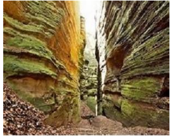
Un passage parmi les roches معبّر بين الصخور