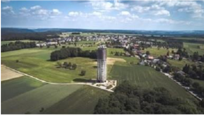
l'Aqua tower où l'on peut monter برج الماء حيث بالإمكان الصعود