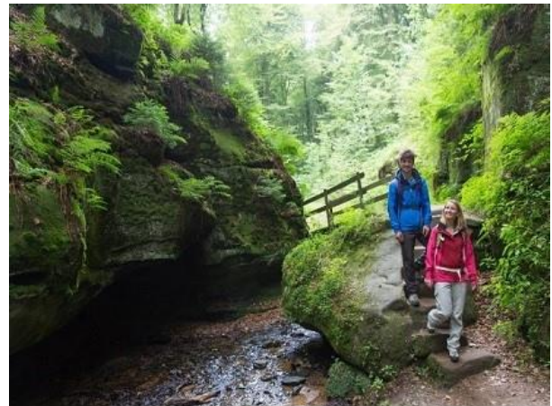
la promenade est très agréable الزهوة في غاية المتعة