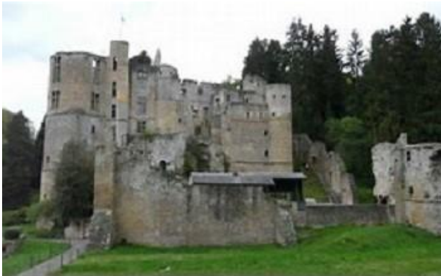
Un 2 e château se trouve derrière يوجد قصر ثاني في الخلف