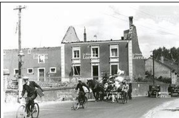
يهجر السكان ميادين القتال وينتشر الآلاف من الناس عبر الطرق Les populations fuient les combats ; des milliers de gens sont sur les routes