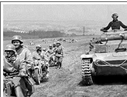
تفتحم القوات الألمانية كل من لكسمبورغ و بلجيكا Les troupes allemandes foncent à travers le Luxembourg et la Belgique